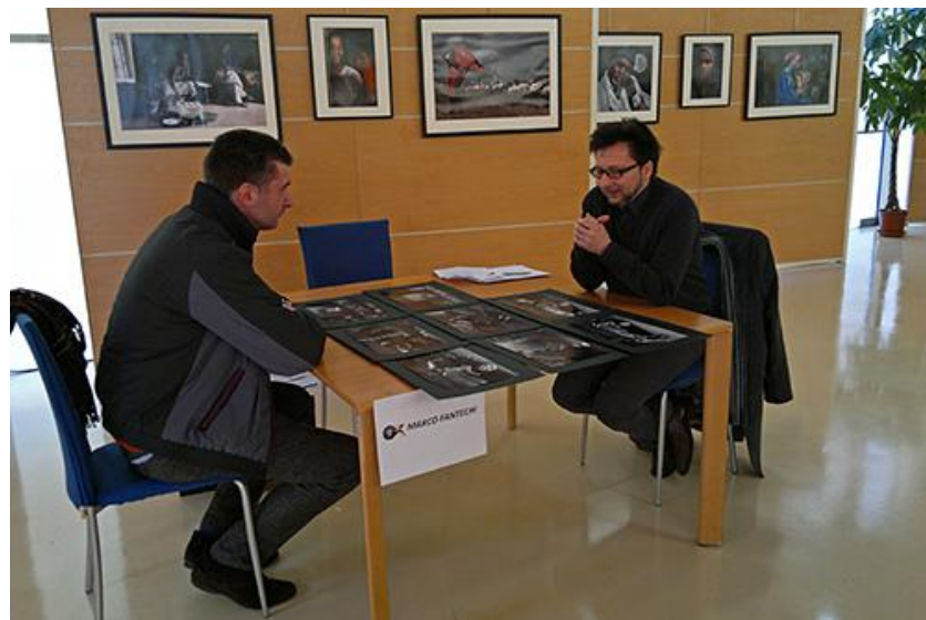
Lettura portfolio organizzata dal G.F. "Amici di scatto" ( www.amicidiscatto.it )

Cogliendo un elemento dopo l'altro, lo sguardo che vaga sulla superficie delle immagini produce fra gli elementi relazioni temporali. Esso può tornare a un elemento dell'immagine che aveva già visto, e il "prima" diventa un "poi": il tempo ricostruito attraverso questo scanning è il tempo dell'eterno ritorno dell'uguale.