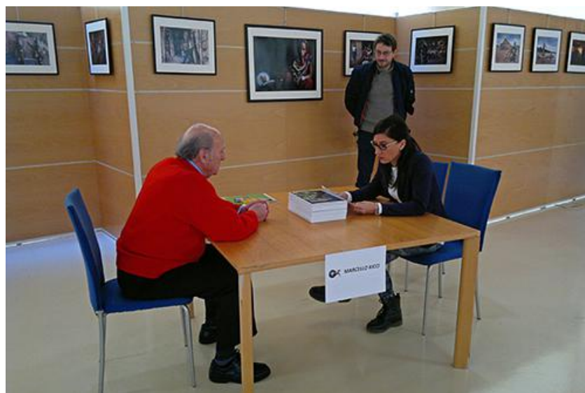
Lettura portfolio organizzata dal G.F. "Amici di scatto" ( www.amicidiscatto.it )

Se vogliamo approfondire il significato, vale a dire ricostruire le dimensioni sottoposte all'astrazione, dobbiamo lasciar vagare lo sguardo sulla superficie.