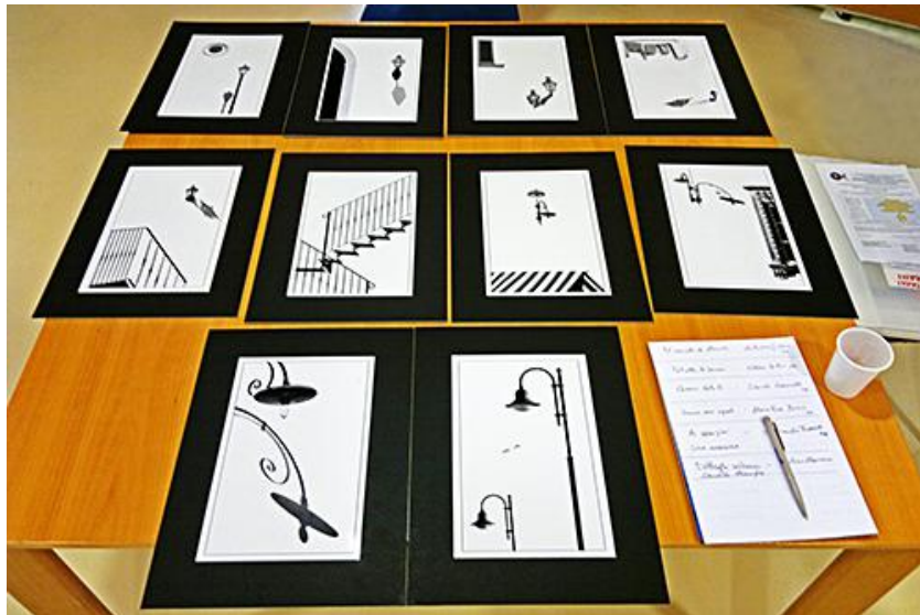
Lettura portfolio organizzata dal G.F. "Amici di scatto" ( www.amicidiscatto.it )

Esso può sempre tornare a un elemento specifico dell'immagine, elevandolo così a portatore del significato dell'immagine. Nascono allora complessi semantici nei quali un elemento conferisce significato all'altro e da questo ottiene il proprio significato....>>