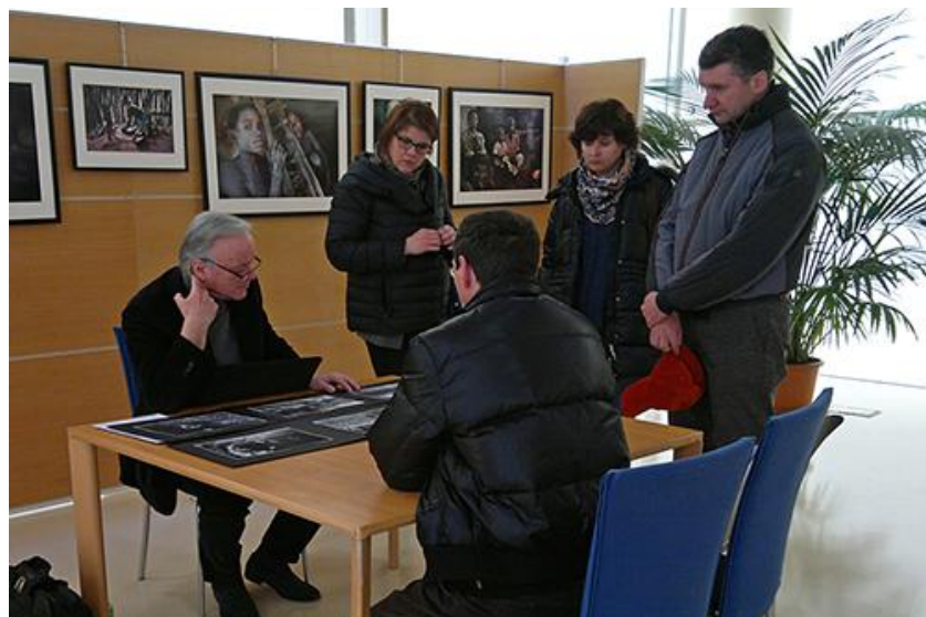
Lettura portfolio organizzata dal G.F. "Amici di scatto" ( www.amicidiscatto.it )

Ecco perché quando inquadrriamo è importante studiare l'andamento delle linee di forza che attraversano la composizione, tracciare un percorso che conduca lo sguardo al punto significativo dell'immagine, il punto da dove deve iniziare la nostra lettura.