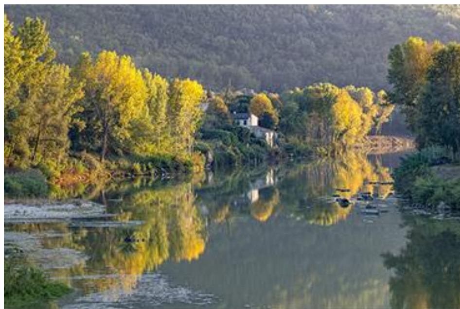
"Arno a Le Sieci" di Stefano Ermanni