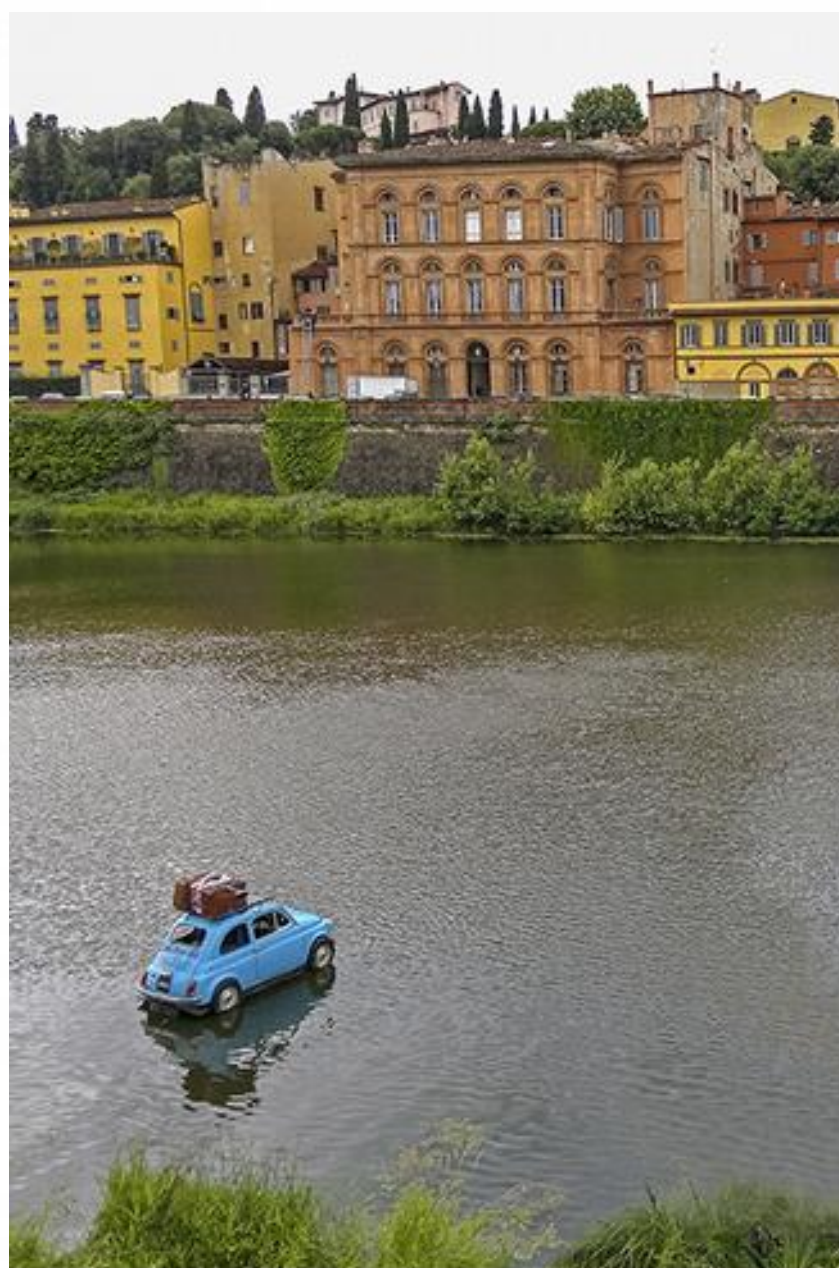
"Vie d'acqua" di Marco Fantechi