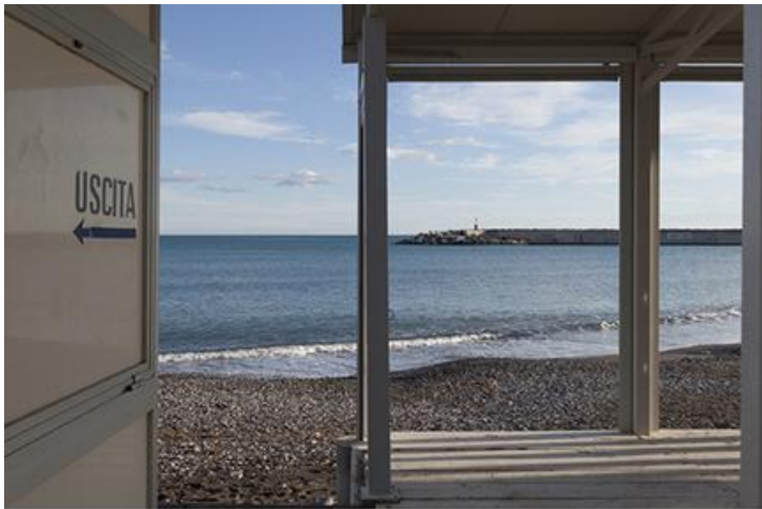
“Errata corrige: Entrata” di Gabriella Novelli

Marco Fantechi - Interessante composizione, precisa e pulita, ci lascia il silenzio necessario per ascoltare la voce del mare. Solo dopo la sguardo viene richiamato dalla scritta "USCITA", quasi una continuazione della linea dell'orizzonte è la freccia che la sottolinea, inversa al nostro pensiero per il quale l'uscita è davanti a noi.