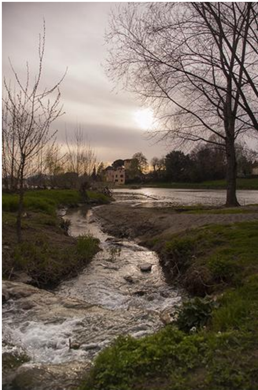
“Arno a Rovezzano” di Marco Fantechi