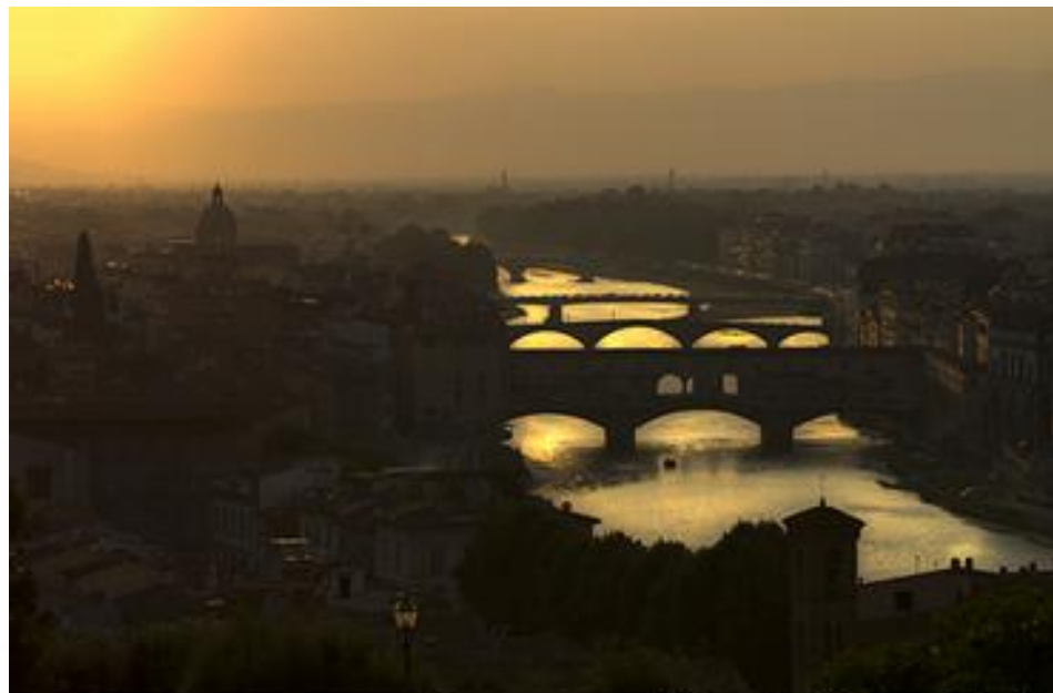
"Tramonto sull'Arno" di Bruno Simini