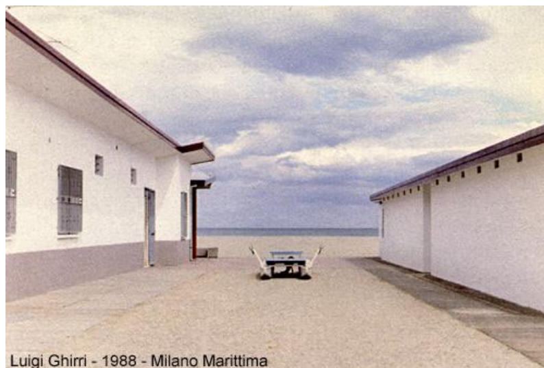
Luigi Ghirri - 1988 - Milano Marittima

La poesia non esiste di per sé stessa, siamo noi che ne abbiamo bisogno e la facciamo esistere, quindi perché non pensare anche a una fotografia che sia il tentativo di raccontare su una prospettiva positiva, forse basta la bellezza silenziosa delle piccole cose quotidiane, immagini che sappiano vestirsi delle parole della speranza e, paradossalmente per l'essenza propria della fotografia, arrivare a raccontare anche il futuro.