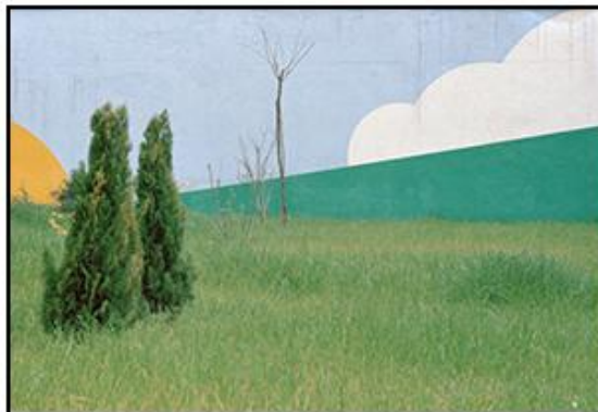
Luigi Ghirri "Modena 1973"

In questa immagine, come in quella di copertina, lo sfondo è una parete dipinta. Luigi Ghirri definiva queste immagini foto montaggi naturali.