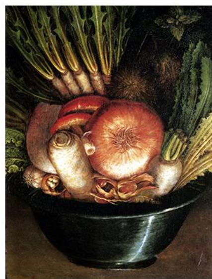
Giuseppe Arcimboldi (1526 - 1593) - "L'ortolano" Lo stesso dipinto ruotato di 180° è una ciotola con verdura, la percezione della figura umana avviene grazie a una visione globale