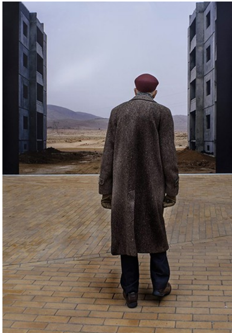
“Oltre...” di Alma Schianchi