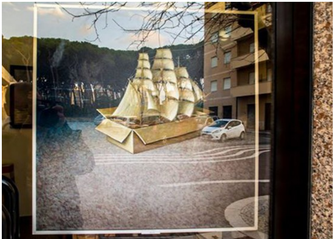
“Riflessi” di Michele Marini