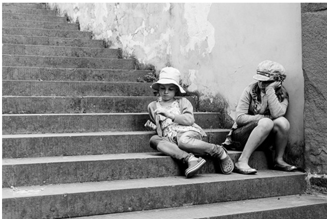
“La noia” di Sergio Sherman