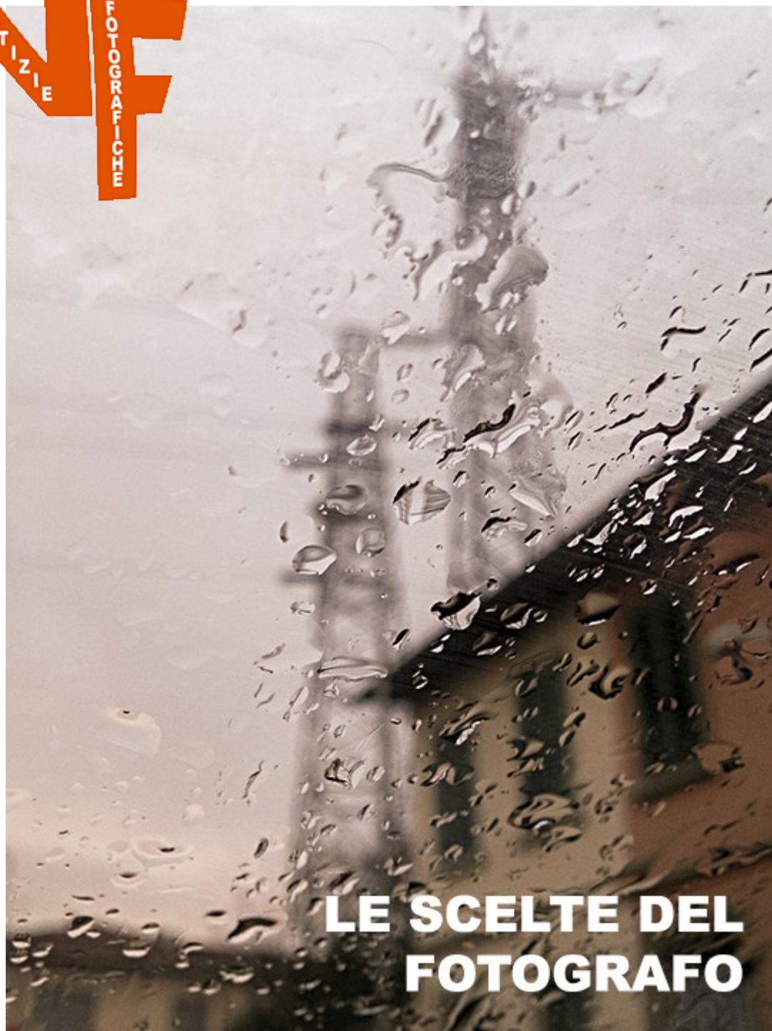
IMMAGINE NOTIZIE FOTOGRAFICHE