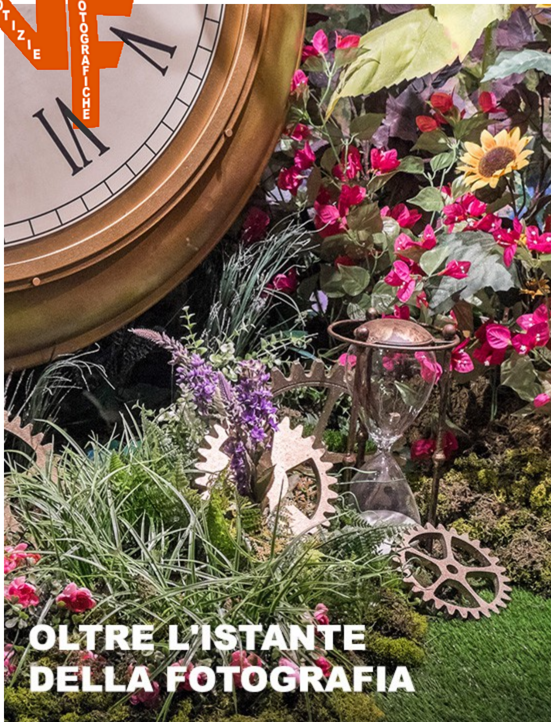
IMMAGINE NOTIZIE FOTOGRAFICHE