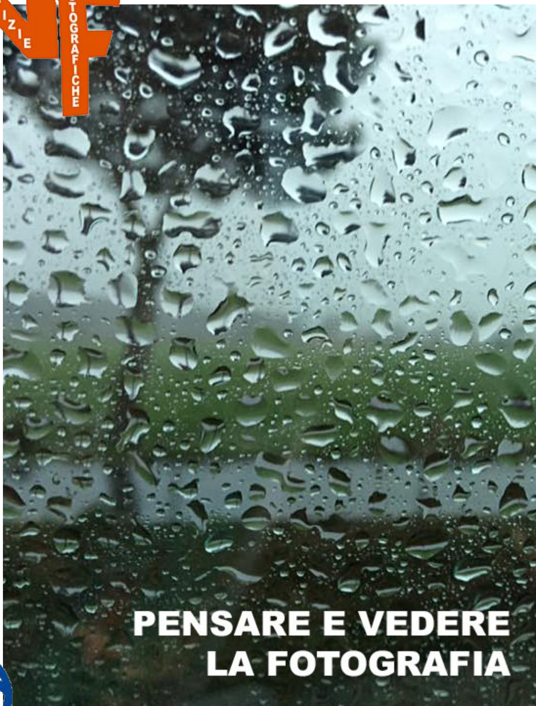
IMMAGINE NOTIZIE FOTOGRAFICHE