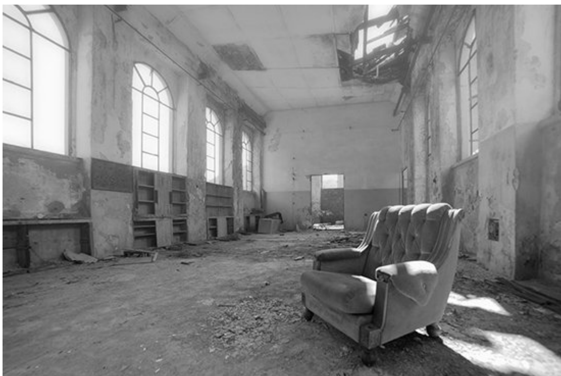
“Ex polveriera di Aulla” di Bernardo Zanni