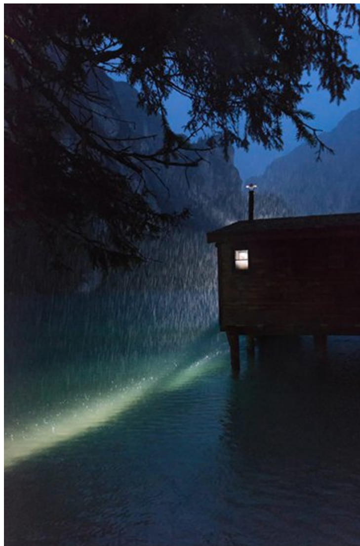
“Il rifugio” di Riccardo Fantinato