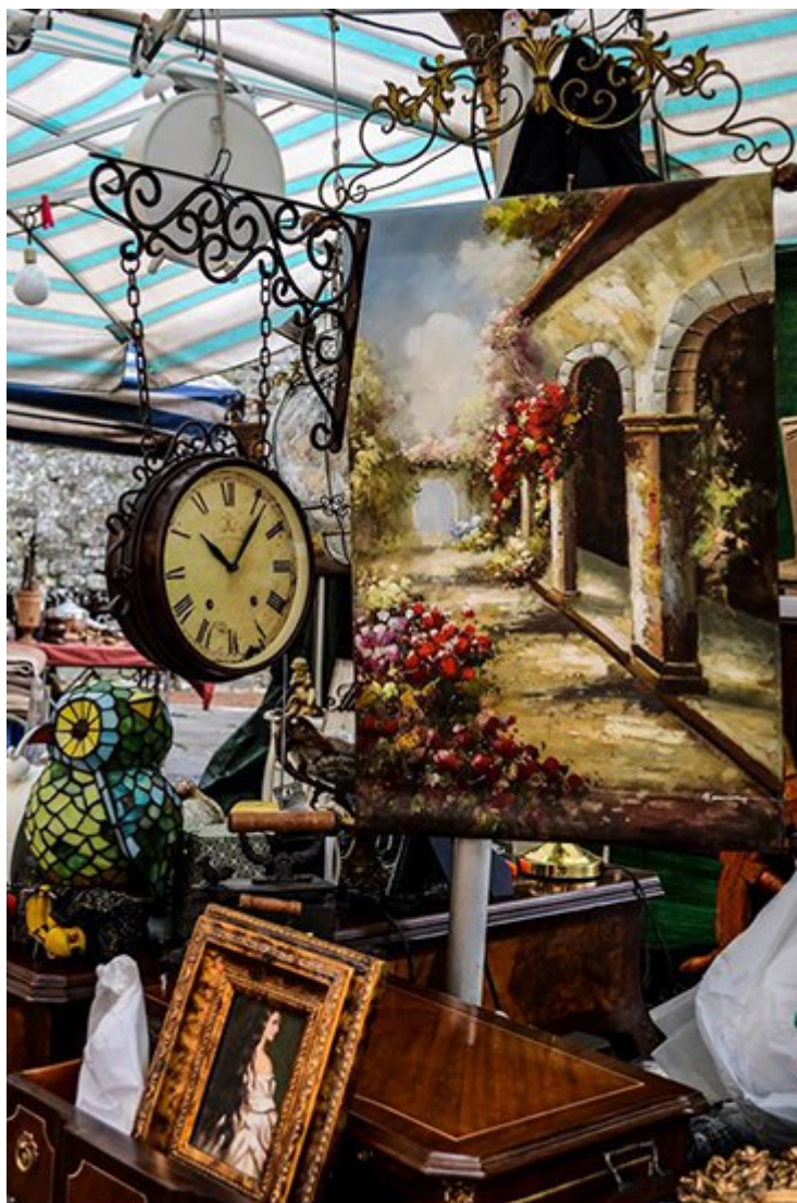
“Altri Tempi” di Veronica Cecchi