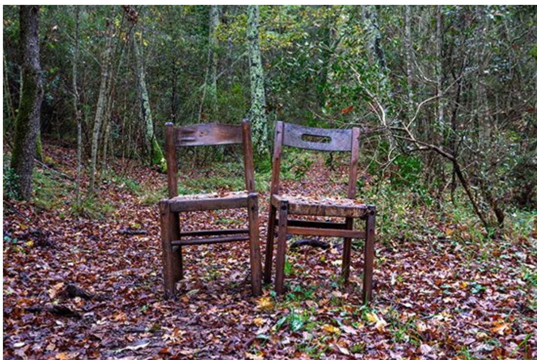
“Il silenzio del bosco” di Michele Marini