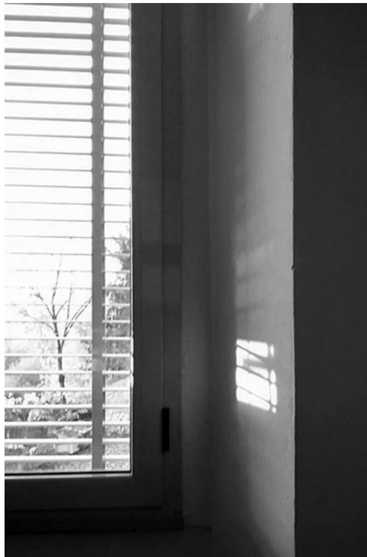
“Semplice riflesso” di Veronica Cecchi