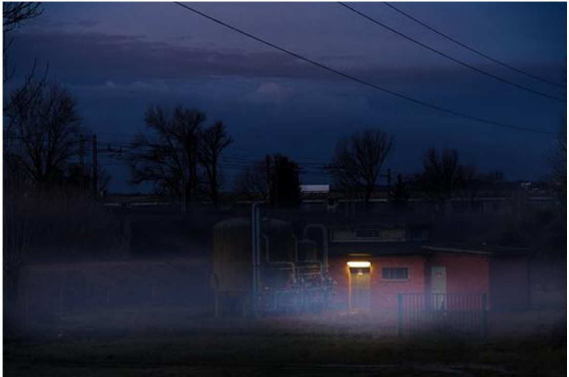
“Aurora a San Donnino” di David Bartolini