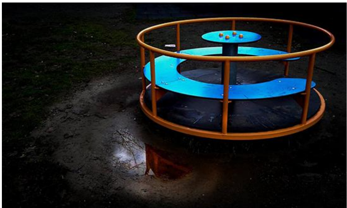
“Assenze” di Alma Schianchi