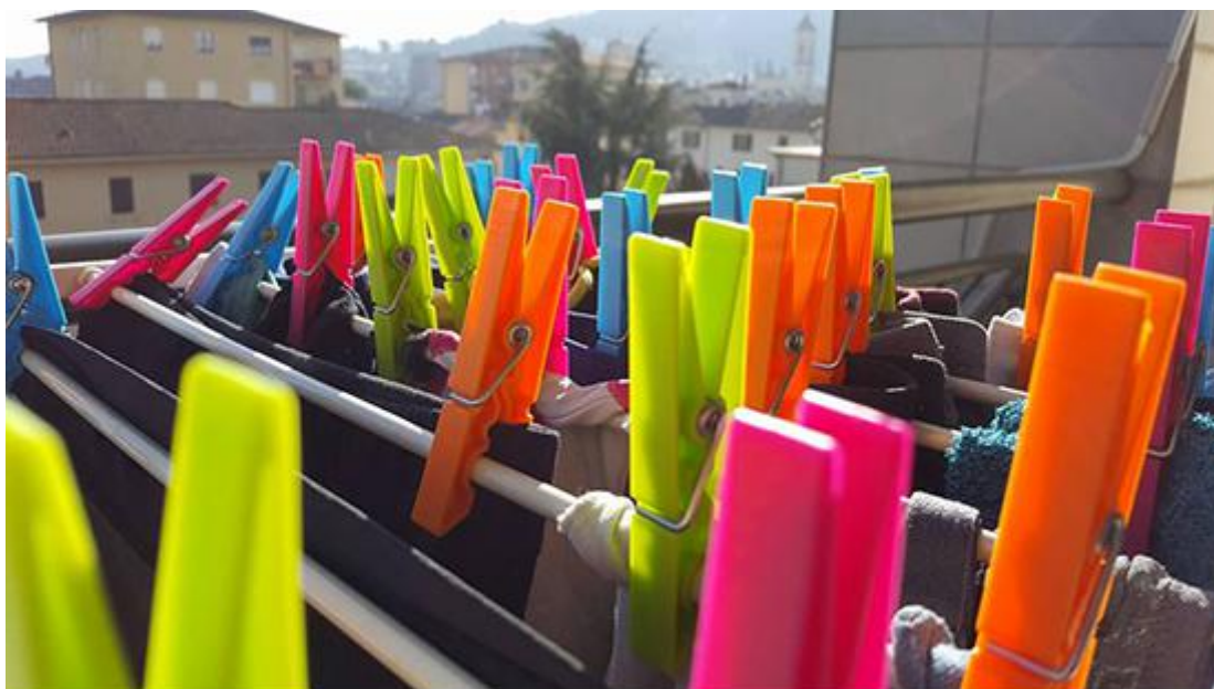
“Colorandia” di Veronica Cecchi