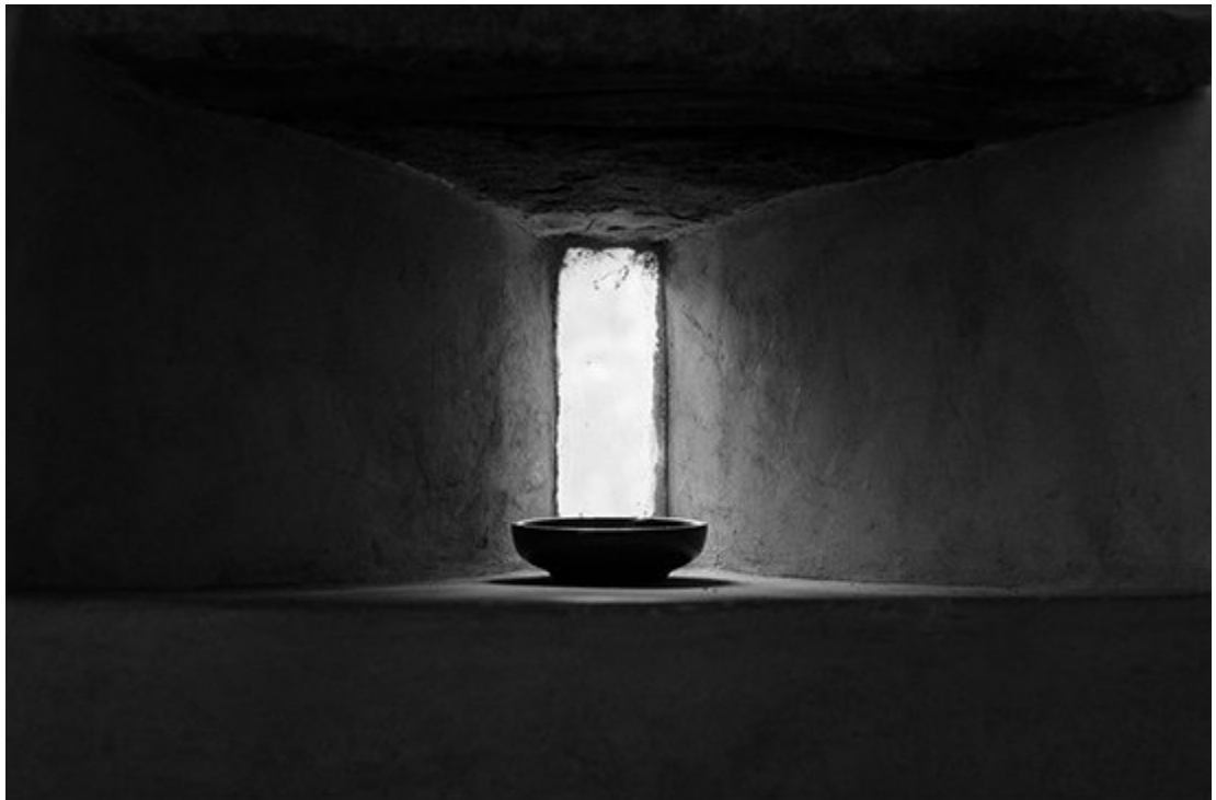
“Semplicemente vuoto” di Sergio Sherman