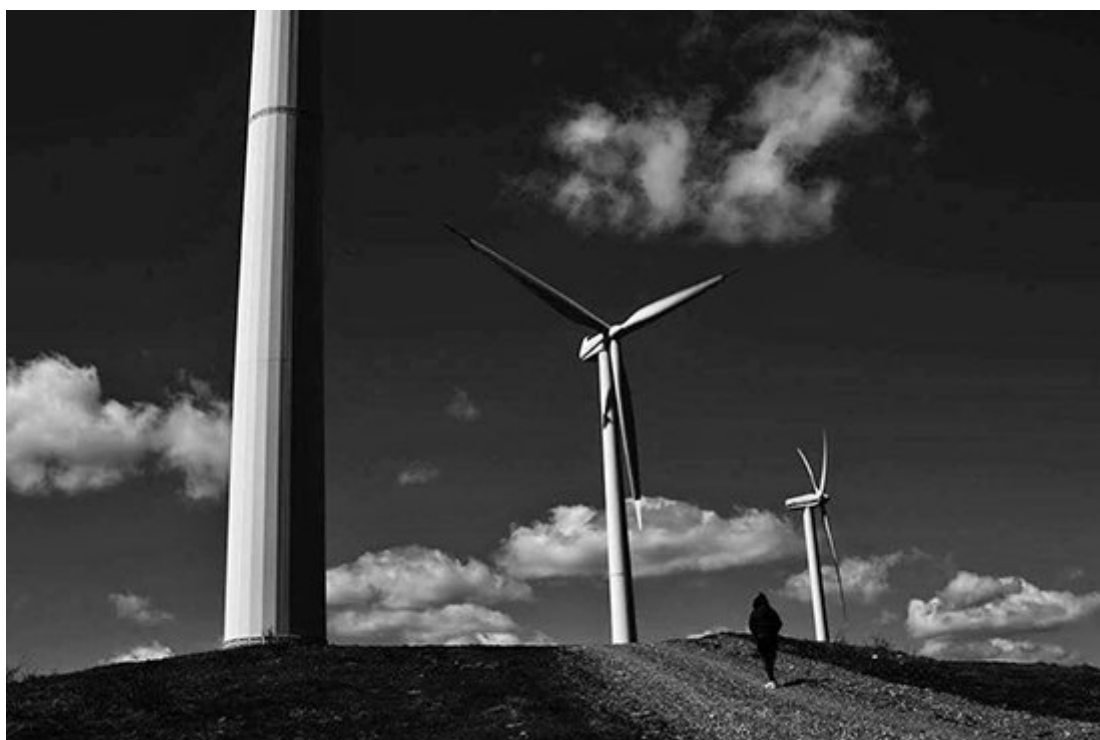
“Ascese” di Maurizio Donati