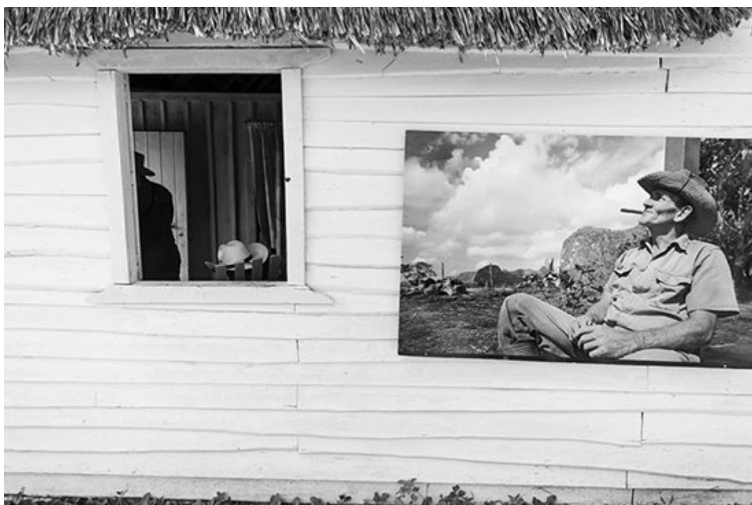
“Tutto ha una fine... eccetto i sogni” di Marco Bartolini