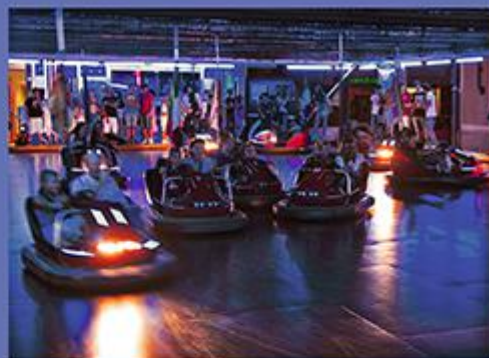
Dopo le luci e i suoni...