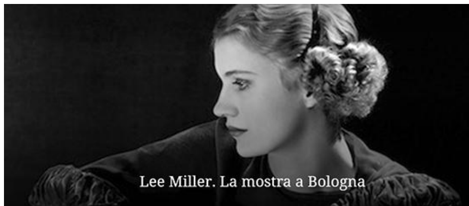
Lee Miller. La mostra a Bologna