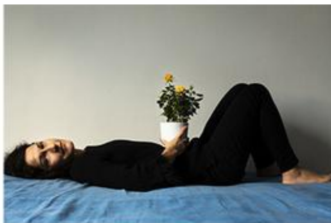
“Planet Earth is blue and there is nothing I can do” di Enos Montoani e Sabrina Masoli