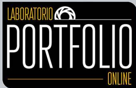
PHOTO PORTFOLIO FIRENZE on-line